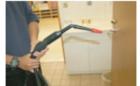
普通にこうやって持つけど