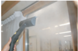
窓に吹き付けまーす