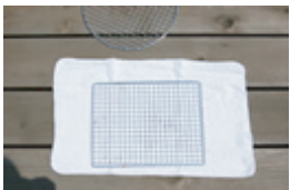
また使いたいのにな(泣)