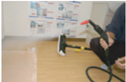
窓の下にタオルを敷いたら