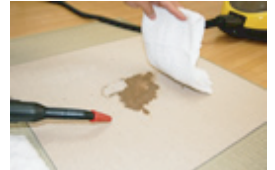
タオルで覆ってから...