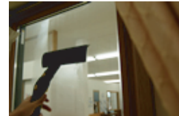
ゴムベラ部分で水切り