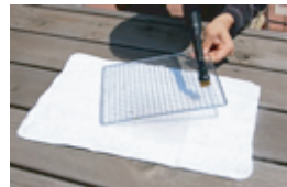
もっとキレイになる！