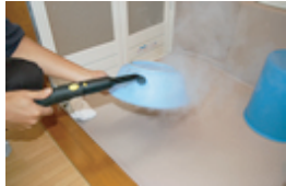
うおーっ！ どんどん落ちる。