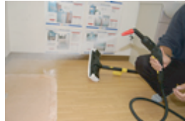
コレでやっつけます！