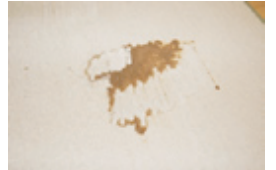
あっという間に消えていく。