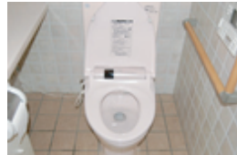
トイレに来てみました。