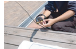
さらに真鍮ブラシだと...