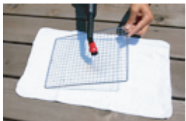
でもこれで大丈夫。