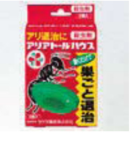
アリアトールハウス