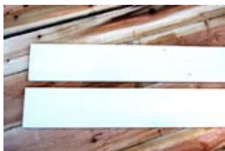
DIY材 1820×13×150mm 1本