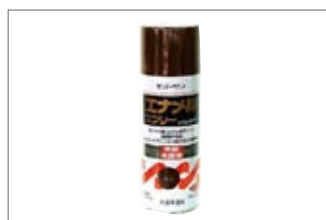
ラッカースプレー