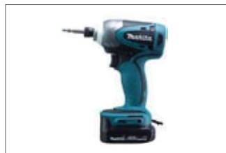
ドリルドライバー