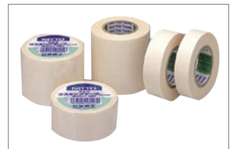
マスキングテープ