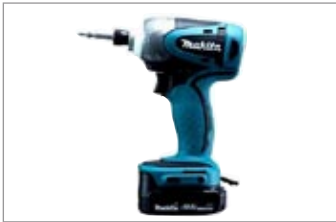
ドリルドライバー