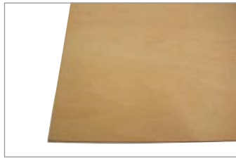
ベニア板 (900×900×4mm) 1枚