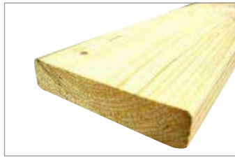
1×4材 (19×89×1829mm) 1枚