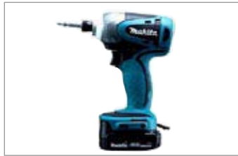
ドリルドライバー