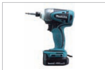
ドリルドライバー