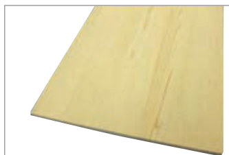
DIY木材 板 600×13×300mm … 1枚