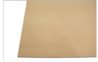
カットシナベニア板 約900×600×9mm 1枚