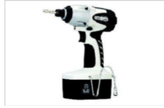
インパクトドライバ