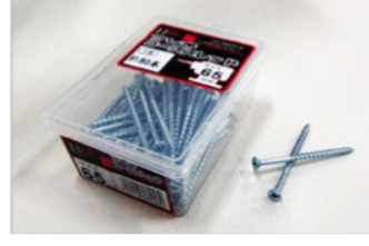
HCコーススレッドフレキ