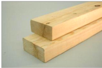
2×4材 約1,820×89×38mm 3枚