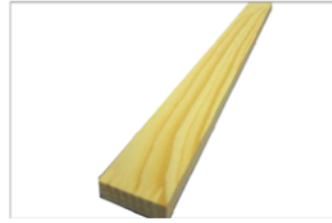
DIY木材 角 約1,820×30×12mm 2枚