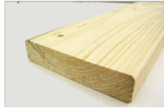
1×4材 約1,829×89×19mm 10枚