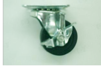
ストッパーゴムキャスター 2個