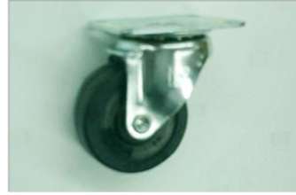
自在ゴムキャスター 2個