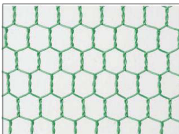
ビニールキッコウ金網