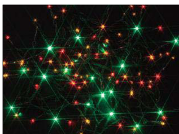
ソーラーイルミネーション 50球 マルチ KM-ST50M