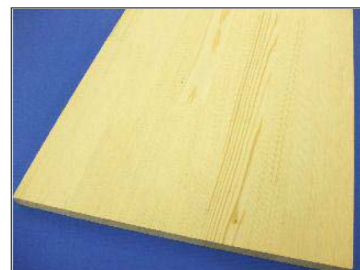
DIY 木材 板 600×13×300mm