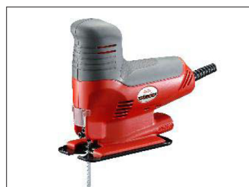
リョービ ジグソー CJ-250