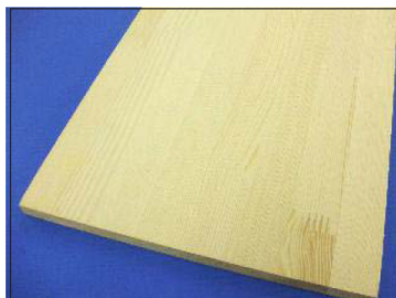
DIY 木材 板 600×13×240mm