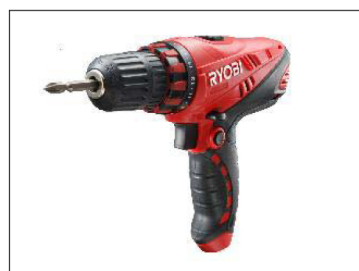
リョービ ドリルドライバー CDD-1020