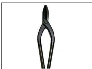
KG 金切鉗直刃 240mm