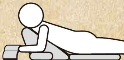
●肘置きを使ってうつぶせ