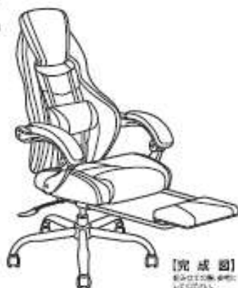
【完成図】 組み立て後、必ず ご確認ください。