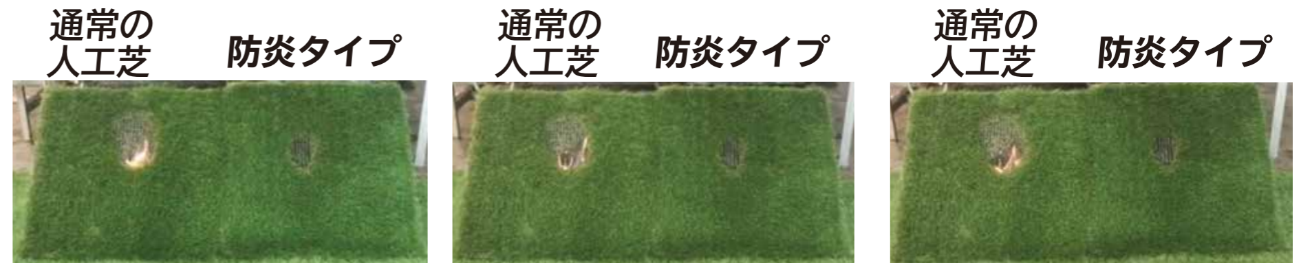
通常の人芝 防火タイプ 通常の人芝 防火タイプ 通常の人芝 防火タイプ 放射直後 20 秒後 30 秒後

防火タイプはバーナーを離れた直後に消火したが、通常タイプは 30 秒経過しても延焼しています。