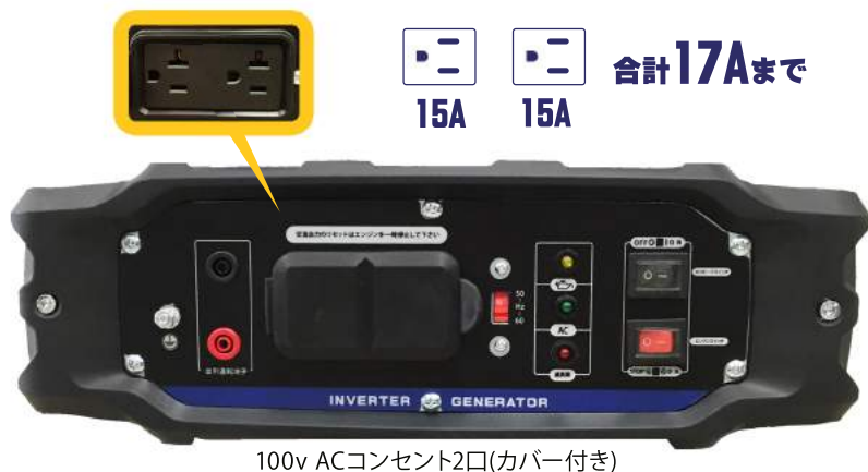
100v ACコンセント2口(カバー付き)