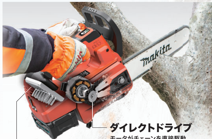
ダイレクトドライブ モータがチェーンを直接駆動 高速ハイパワーで切断可能。