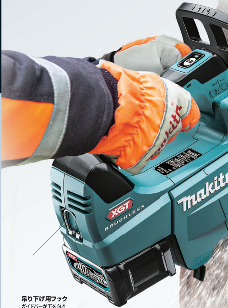
吊り下げ用フック ガイドバーが下を向き スムーズに吊り下げ可能

(モータ部: 3.2kg; バッテリBL4025含む。ガイドバー、チェーン刃、チェーンオイル含まず)