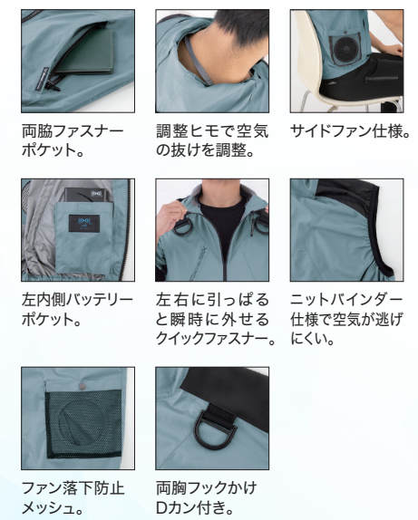
両脇ファスナーポケット。