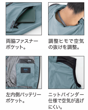
両脇ファスナーポケット。