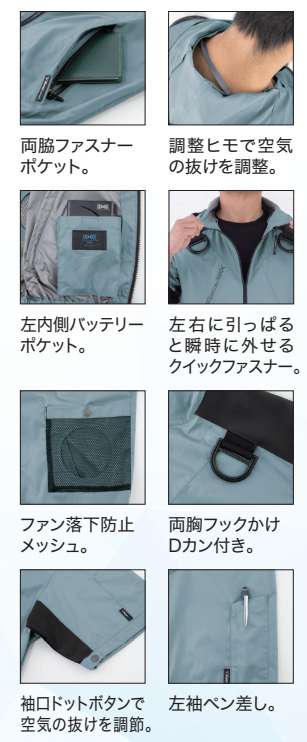
両脇ファスナーポケット。