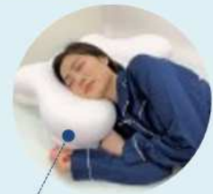
ポリエステル100%のしっかりメッシュが 寝姿勢を安定させます。