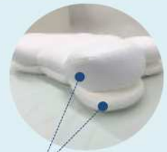
メインのストレッチ生地の他にサイドには 伸びないメッシュ生地を使用しています。

サイド全面に周るりとマチを付けています。 伸びないマチ生地が枕全体のポリウムバランスを調整します。 しっかりメッシュなので枕に必要な高さをきちんとキープ！