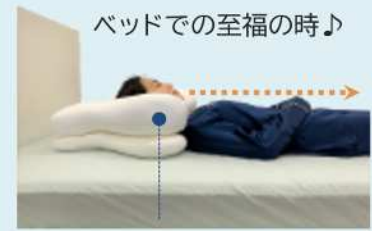
圧力が掛かると中材が沈むので、一直線のキレイな寝姿勢 になります。