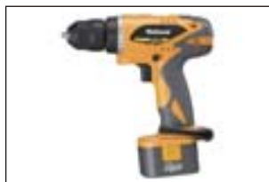
ドリルドライバ 1個