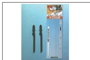
ジグソー刃 円切用