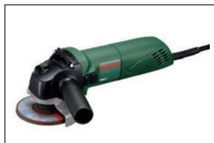
ディスクグラインダ 1個