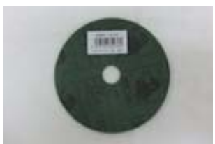
ファイバージスク