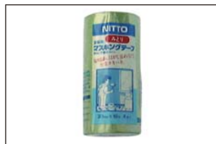
マスキングテープ