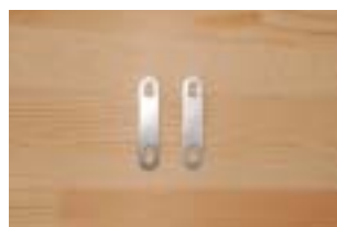
ユニクロUボルト プレート 1/4×2