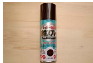
水性ラッカースプレー