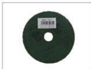
ファイバージスク