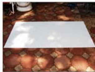
カラー合板 910×1820×2.5mm 1枚