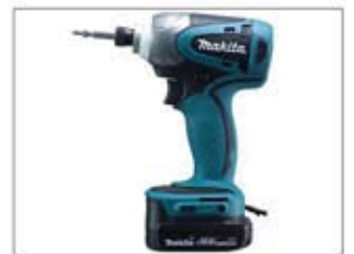
ドリルドライバー