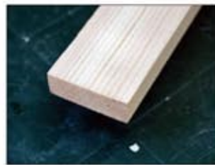
木材板 15×45×1985mm 4本