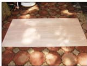
ベニア板 900×1800×5.5mm 1枚