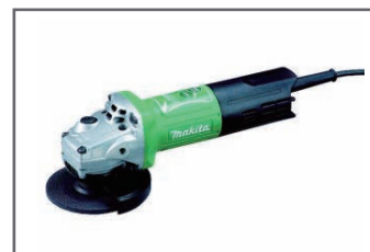
ディスクグラインダー