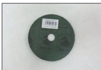
ファイバージスク