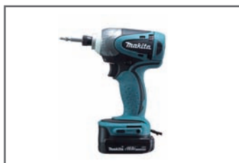
ドリルドライバー