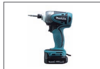
ドリルドライバー