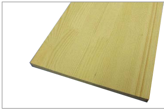
DIY材 板 1820×13×240mm 2枚