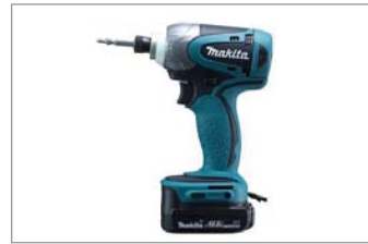
ドリルドライバー